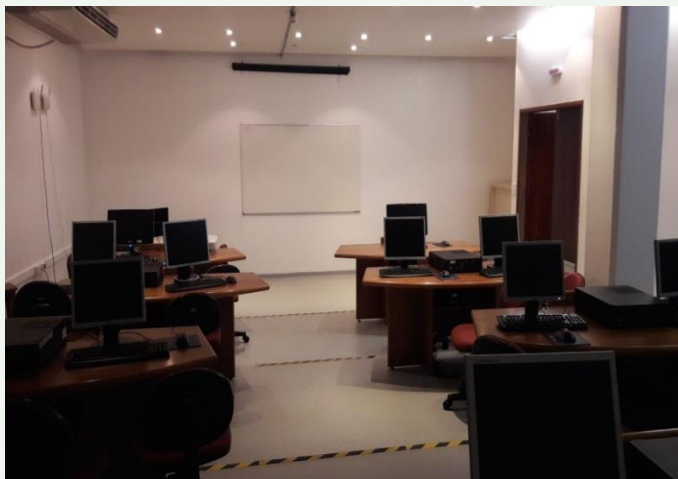
Sala de cursos